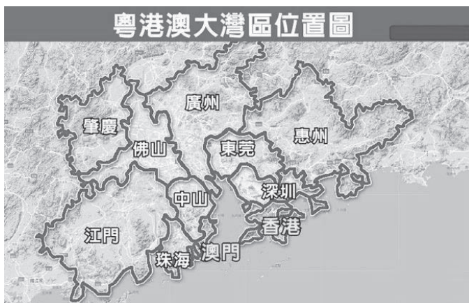
圖2 粵港澳大灣區位置圖

中國正在建設京津冀、滬寧杭、粵港澳三大灣區 19 ，中央希望充分發揮深圳前海、廣州南沙、珠海橫琴、福建平潭等開放合作區的作用，充分深化與港澳合作，打造粵港澳大灣區（如圖2所示）。