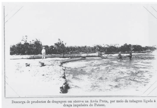
圖1 1923年，在馬交石一帶進行填海工程，造成黑沙環的大片土地