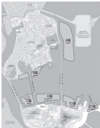
圖2 澳門新城區區位示意圖