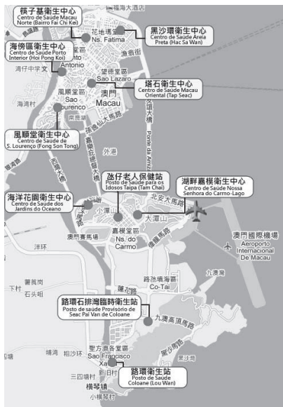
圖3 澳門衛生中心及衛生站分佈示意圖