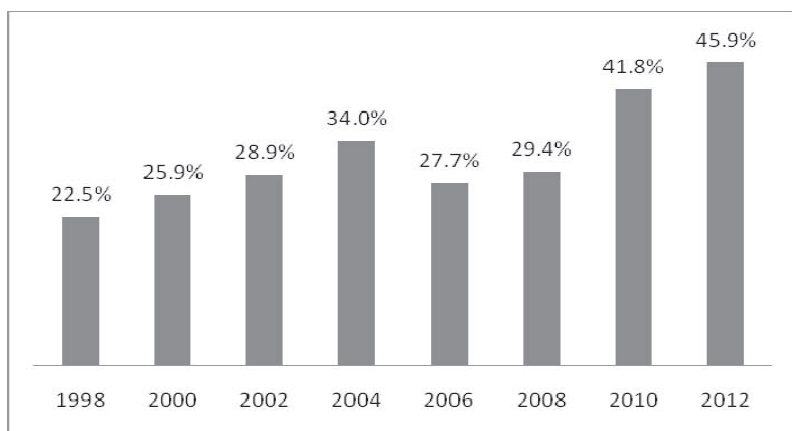
圖3 澳門博彩業佔GDP的百分比（以當年價格計算）