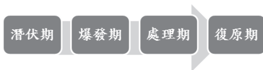
圖1 Fink 的危機四階段圖